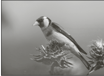
Man nennt ihn aus Gründen manchmal auch Distelfink.

Der Stieglitz ist ein hübsches, kleines ausgesprochen buntes Kerlchen aus der Familie der Finken. Mit seiner schwarz-roten Gesichtsmaske, dem weißen Bauch und schwarz-gelb gezeichneten Flügeln fällt er auf. Er ernährt sich bevorzugt vegetarisch, von Sämereien von Stauden, Wiesenpflanzen (sehr gerne Disteln!) und Bäumen. Wenn da, insbesondere in der Brutzeit, mal eine Blattlaus danebensitzt, wird die ohne Gewissensbisse mitgegessen.