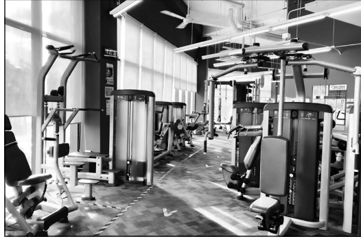
Der Himmel weiß, was man mit all diesen Foltergeräten anstellen kann.

Zum Glück habe ich jetzt ein Ausstattungsmerkmal meines Fitnessstudios entdeckt, das den Mischwald alt aussehen lässt. In der Sauna zu schwitzen zählt ja wohl hoffentlich auch als Sport. Oder ...?