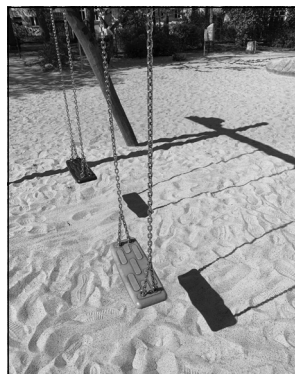
Geburtenknick oder steigende Mieten? Verwaiste Schaukel auf einem Spielplatz.

Chatgruppen mit Elternvertretern. Wer noch nicht Personal abgebaut hat oder Schließung fürchtet, sucht händer-