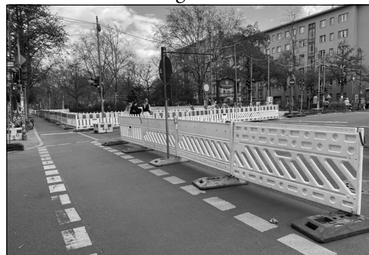
Umfangreiche Sperrungen wegen Wasserleitungsarbeiten an der Gneisenaustraße.

Grund dafür sind die bereits in 2025 in der Baerwaldstraße begonnenen umfangreichen Bauarbeiten der Berliner Wasserbetriebe. Insgesamt 4 km Trinkwasser- und Abwasserdruckrohrleitungen müssen ausgewechselt werden. Außerdem sollen entlang des Baufeldes einige klei-