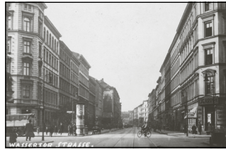
In der Wassertorstraße befanden sich vor 1945 zahlreiche Gewerbebetriebe.