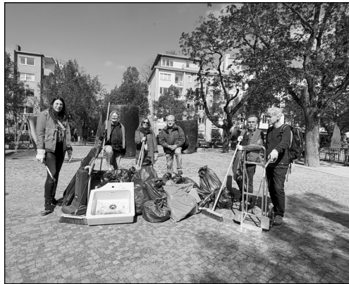
Clean-up-Aktion am Marheinekeplatz.

Wer mitmachen, sich informieren oder eigene Ideen einbringen möchte, findet weitere Informationen unter www.bergmannkiezrat.de .