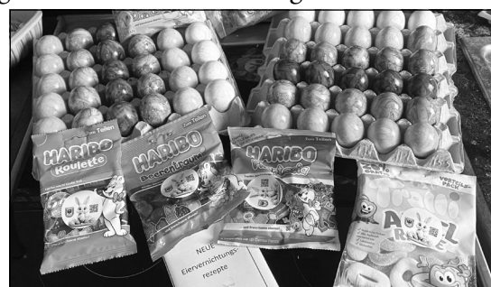
Tagesausbeute einer durchschnittlichen dreiköpfigen Familie.

Seit 1977 gibt es die Veranstaltung in der Partnerstadt Ingelheim, und anders als der Name