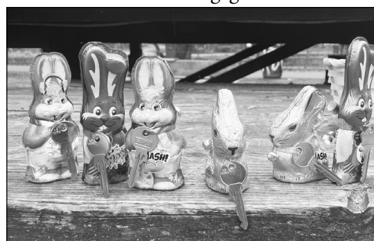
Schokohasen mit Görli-Generalschlüsseln wurden an Parkbesucher verteilt.

Parallel dazu wurde eine Pressemitteilung der »Gewerkschaft der Osterhasen*« (GdO) veröffentlicht. »Wir Osterhasen* sind auch gar nicht