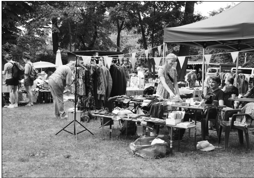
Beim Hof-Flohmarkt im Garten des Nachbarschaftshauses können Trödel, Spielzeug und Kleidung für Kinder und Erwachsene verkauft werden.

Parallel zum Hof-Flohmarkt bieten wir wieder eine Pflanzentauschbörse an. Du suchst Kräuter und bunte Pflanzen für deinen Balkon? Du hast Saatgut und Jungpflanzen zum Tauschen abzugeben? Bringt Eure Pflanzenspenden einfach mit, beschriftet sie gerne mit dem Namen und gegebenenfalls einem Pflegehinweis. Außerdem könnt ihr die Infostände unserer Gruppen entdecken, verschiedene Mitmachangebote ausprobieren oder eure eigenen Pflanzentöpfe gestalten – bringt dafür gerne