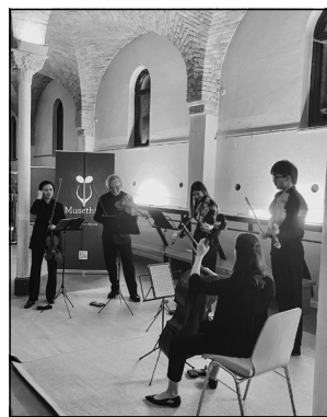
Das vorerst letzte Musethica-Konzert im Kiezraum.

mit großer Präzision und Ausdruckskraft. Die Nähe zum Publikum und die konzentrierte Atmosphäre machten das Konzert besonders eindrucksvoll.