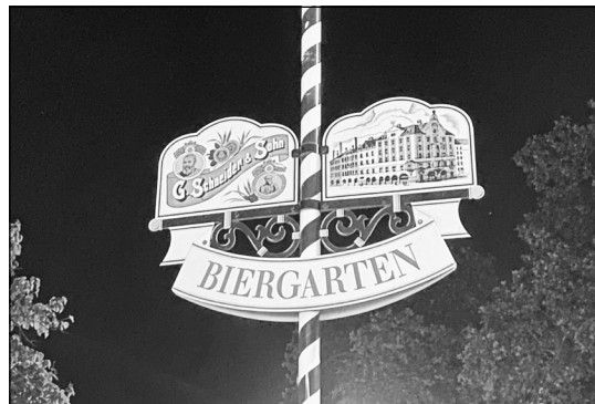
Zumindest in sogenannten Ausgehvierteln soll künftig längere Außengastronomie erlaubt sein.

Der Senat hat einen Entwurf für ein neues Gaststättengesetz auf den Weg gebracht, das nicht nur längere Öffnungszeiten für die Außengastronomie ermöglichen soll, sondern auch vereinfachte Verfahren bei der Eröffnung neuer Betriebe verspricht. Nach dem Willen von Wirtschaftssenatorin Franziska Giffey (SPD) soll das Gesetz noch in diesem Sommer in Kraft treten.