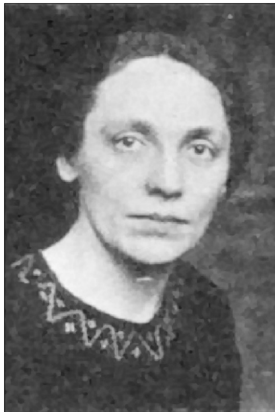
Marie Juchacz um 1919.

Heute erinnert ein Denkmal am Rande des Mehringplatzes an die ehemalige AWO-Zentrale und an Marie Juchacz.