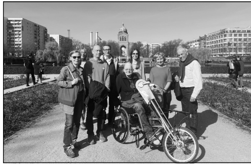
Die Ortsgruppe Friedrichshain-Kreuzberg unterwegs

Vereins ist dabei, möglichst getrennte Wege für Fuß- und Radverkehr bereitzustellen. Leider ist dies nicht überall möglich, wenn z.B. ein Grundstück direkt an den bestehenden Weg