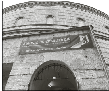
Der Fichtebunker hat eine bewegte Geschichte.

Auch in der Dresdener Straße gab es einen