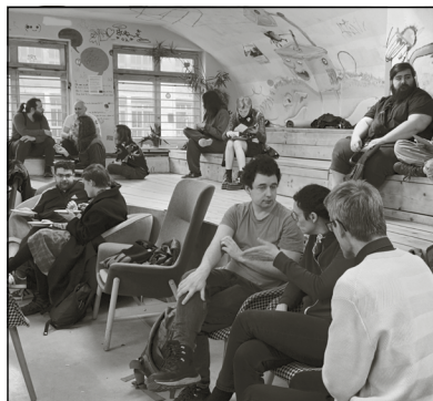
Reges Interesse und Austausch an der SfE.

Ein Alumni-Treffpunkt bot ehemaligen Schüler*innen Raum für Austausch und Wiedersehen. Zudem fand eine Lesung aus dem Buch »Offene Türen und andere Hindernisse: Erfahrungen in einer selbstverwalteten Schule für Erwachsene« (Nitsche/Rothaus, 1982) statt, die Einblicke in die frühen Erfahrungen einer demokratisch organisierten Schule gab. Ein weiterer Höhepunkt war die Vorführung des Dokumentarfilms von Alexander Kleider »Berlin Rebel High School«, der den besonderen Alltag der Schule und die