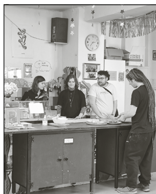
Gemeinschaft, Selbstverwaltung und Engagement.

Geschichten ihrer Schüler*innen zeigt. Dieser Tag bot damit nicht nur ein abwechslungsreiches Programm, sondern auch einen seltenen Blick hinter die Kulissen einer ungewöhnlichen Bildungsinstitution. Für viele Gäste wurde deutlich, wie stark Gemeinschaft, Selbstverwaltung und Engagement das Leben an der Schule prägen. Am Ende des Tages blieb vor allem eines: ein lebendiger Eindruck davon, wie Bildung auch jenseits klassischer Schulstrukturen gestaltet werden kann – offen, gemeinschaftlich und von den Beteiligten selbst. Mehr Informationen unter sfberlin.de . bm