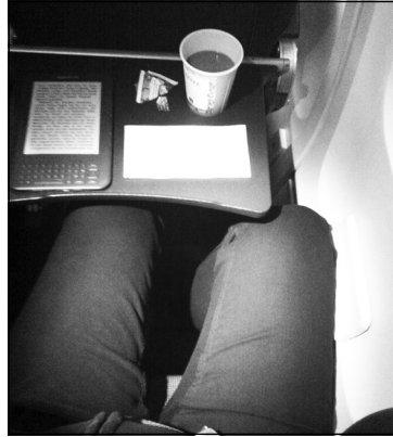
Bei zu viel Beinfreiheit im Flugzeug droht Gefahr durch Kleckern beim Essen.