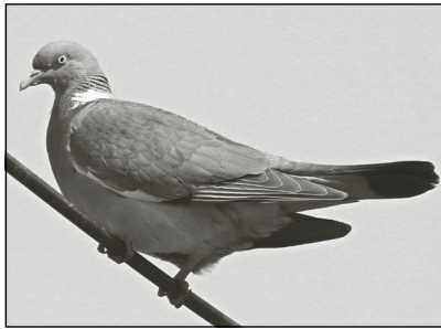
Gut sichtbar: der charakteristische Halsstreifen.

Auf den ersten Blick zu erkennen sind sie an den weißen Flügelbändern und dem weißen Halsstreifen im Nacken – drum auch der Name: Ringeltaube. Der Rest des Gefieders ist silber- bis braungrau.