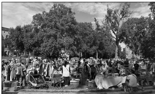
Beim letztjährigen Mariannenplatzflohmmarkt hat das Wetter mitgespielt.

Standanmeldung per E-Mail ab 7. April an: kiezflohmmarkt.mariannenplatz@gmail.com .