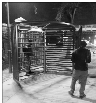
Unspektakuläres Ende einer Investigativ-recherche im Görli-Park.

schwimmen, vermutlich aus Angst zu erfrieren in eisigen Becken, die Betriebskosten sparen.