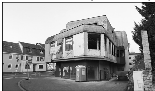
Bis Oktober soll diese Bausünde aus den Siebzigern zu einem lichtdurchfluteten Betonparadies werden.

Wenn es nicht gerade um historischen Bestand aus Zeiten Karls des Großen geht, dann wird in der Partnerstadt Ingelheim in aller Regel weit weniger Aufhebens um olle Immobilien gemacht als im altbauaffinen Kreuzberg. Abriss und Neubau heißt hier im Allgemeinen die Devise, wenn ein Gebäude nicht mehr den aktuellen Ansprüchen genügt. Dass ein Gebäude ein gutes Jahrzehnt lang leer steht, ist jedenfalls ungewöhnlich, dafür ist der Immobilienmarkt in der rheinhessischen Klein-