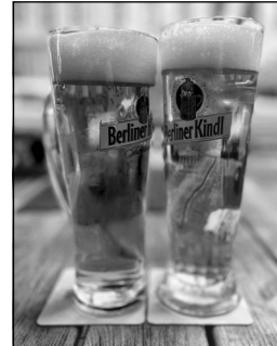
Mehr als Bier. Geschichte und Geschichten im Glas!

sie wurde erst später als vierte Zutat offiziell anerkannt. Heute gilt das Reinheitsgebot als eine