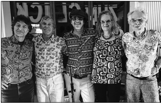
Fünf Musiker, ein Sound: Die HardBeat Five.